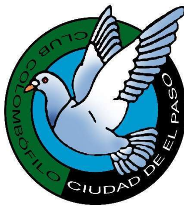
Logotipo del Club Colombófilo Ciudad de El Paso